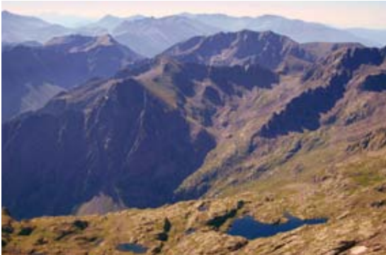
Laghi Lausfer, Rocca di S. Bernolfo e Autaret