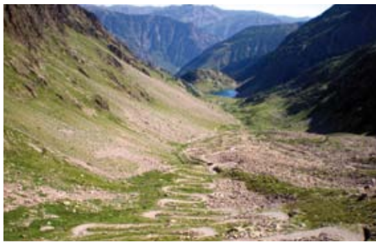
Strada militare che risale il vallone di Collalunga