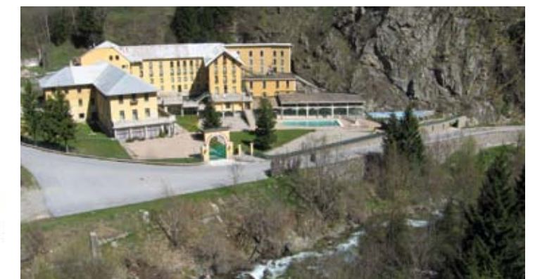
Lo stabilimento termale

Studio Tecnico Della Bella geom.Cristina 333 7456431 cristina.dellabella@tiscali.it