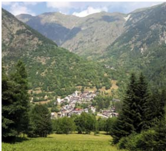
Bagni di Vinadio