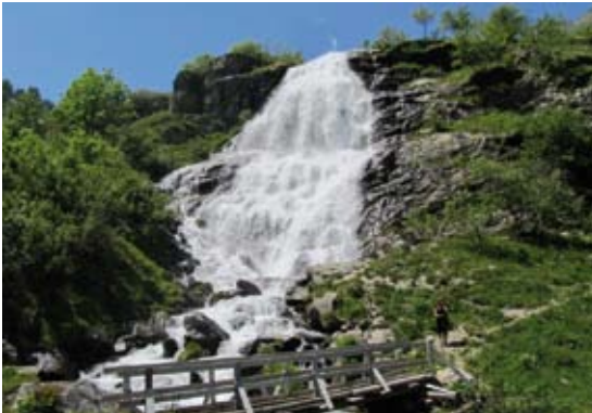
La cascata dei Pisciai